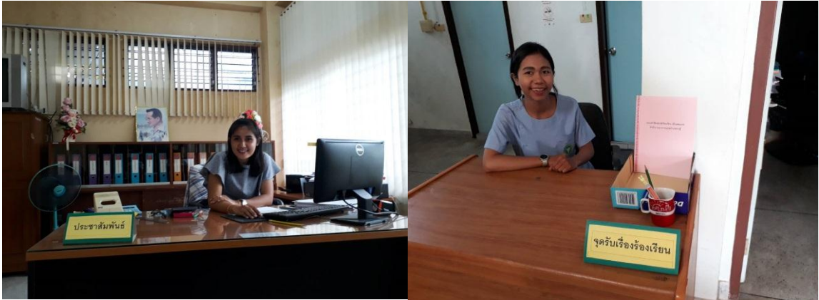
เจ้าหน้าที่รับผิดชอบงานประชาสัมพันธ์และรับเรื่องร้องเรียน