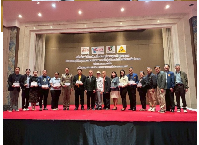
แบบฟอร์มรายงานสรุปผลการดำเนินงานการจัดการป้องกันควบคุมโรคและภัยสุขภาพ ด้วยกลไกการพัฒนาคุณภาพชีวิตระดับอำเภอ ปี ๒๕๖๙